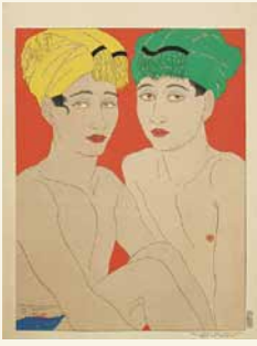
Les Enfants aux yeux jaunes, Ohior, Est Carolinés, 1940