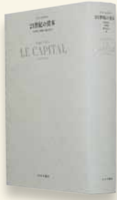
『21世紀の資本』みすず書房2014年刊