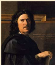
ニコラ・プッサン《自画像》1650年、 ルーヴル美術館蔵