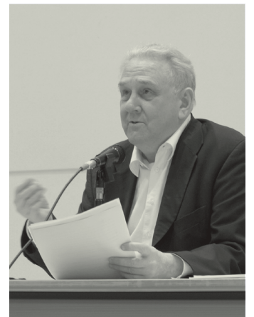
ドミニク・ノゲーズ講演会、2010年5月17日

18時 / 講演会 / ホール 歴史家と社会学者: 表象、象徴的支配、認識 ロジェ・シャルチエ(コレージュ・ド・フランス) / 同時通訳あり