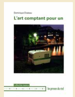
Les Presses du réel, 2009