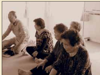
会津若松の仮設住宅に住む被災者

10.24 (木) ◎ 18:30 ~ 20:30 ◎ 1階ホール ◎ 連続講演会「危機を考える」