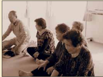
会津若松の仮設住宅に住む被災者

10.24 (木) ◎ 18:30 ~ 20:30 ◎ 1階ホール ◎ 連続講演会「危機を考える」