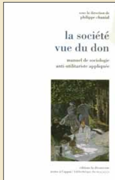
Editions La Découverte, 2008

10.26 (土) ◎ 16:00 ~ 18:30 ◎ 1階ホール ◎ 連続講演会「日仏における考古学と埋蔵文化財」