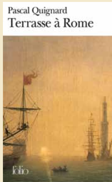
Editions Gallimard, 2000