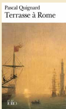
Editions Gallimard, 2000