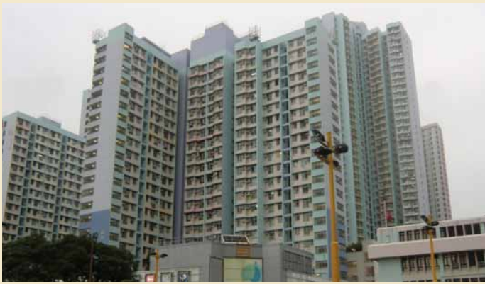
Hong Kong