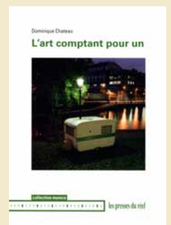
Les Presses du réel, 2009