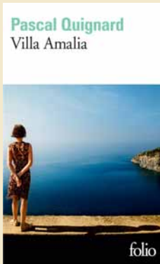
Editions Gallimard, 2006