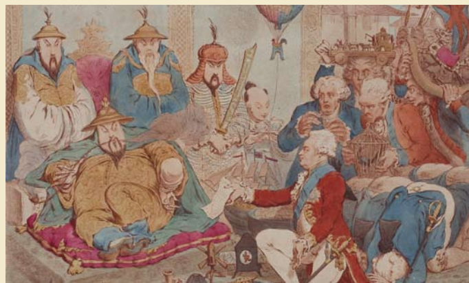
『マカートニーを謁見する乾隆皇帝』ジェイムズ・ギルレイ 1792年 ロンドン

The Reception of the Diplomatique & his Suite, at the Court of Peking James Gillray, 1792, Londres