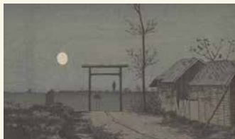
小林清親「浅草田雨太郎稲荷」

小林清親「隅田川夜」(1881年) / Kobayashi Kiyochika, Nuit sur la Sumida (1881) S2003.8.1202 (Freer/Sackler Robert O. Muller Collection).